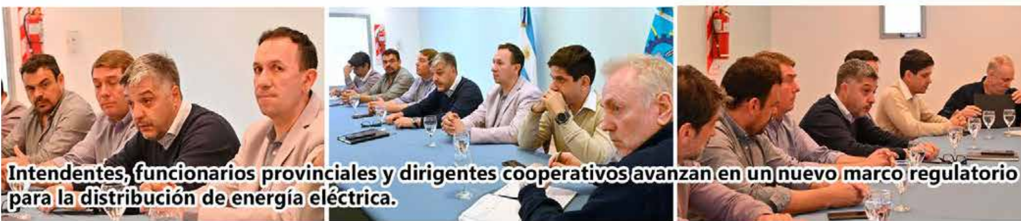
Intendentes, funcionarios provinciales y dirigentes cooperativos avanzan en un nuevo marco regulatorio para la distribución de energía eléctrica.